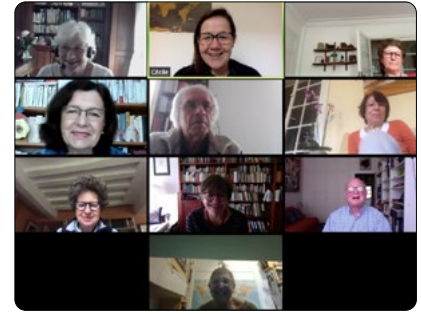
Reprise des activités du Comité de lecture national début mai

L'équipe nationale et les coordinateurs départementaux ont pu poursuivre les échanges durant toute la période du confinement et réfléchir à de nouvelles manières de solliciter les bénévoles, qui