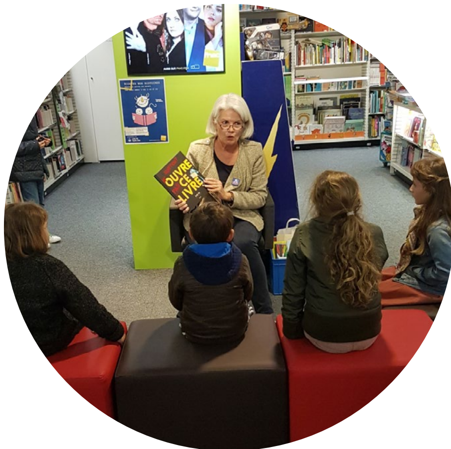
Lecture dans le magasin Fnac à Lille dans le Nord