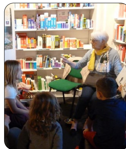
Lecture dans le magasin de Thonon-les-Bains