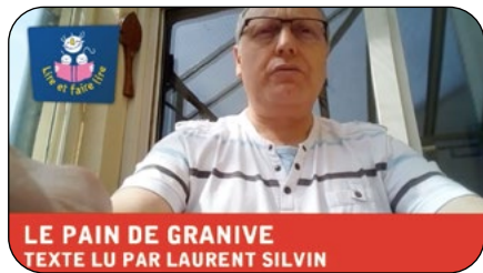
Lectures enregistrées sur des textes écrits et lus par les bénévoles de Savoie. Lien vidéo

Les bénévoles et les coordinateurs sont parvenus à trouver des façons innovantes de continuer à interagir avec les enseignants et les enfants qui bénéficient d'habitude de séances de lecture.